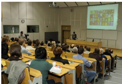
48 Warsztaty Biologii Ewolucyjnej pt. "Year of Darwin" Mówca: Profesor Francisco Ayala (University of California, Irvine)

W lutym 2010 roku odbyły się 50-te Warsztaty Biologii Ewolucyjnej i Zagadnień Pokrewnych. Jest to okazja do podsumowań.